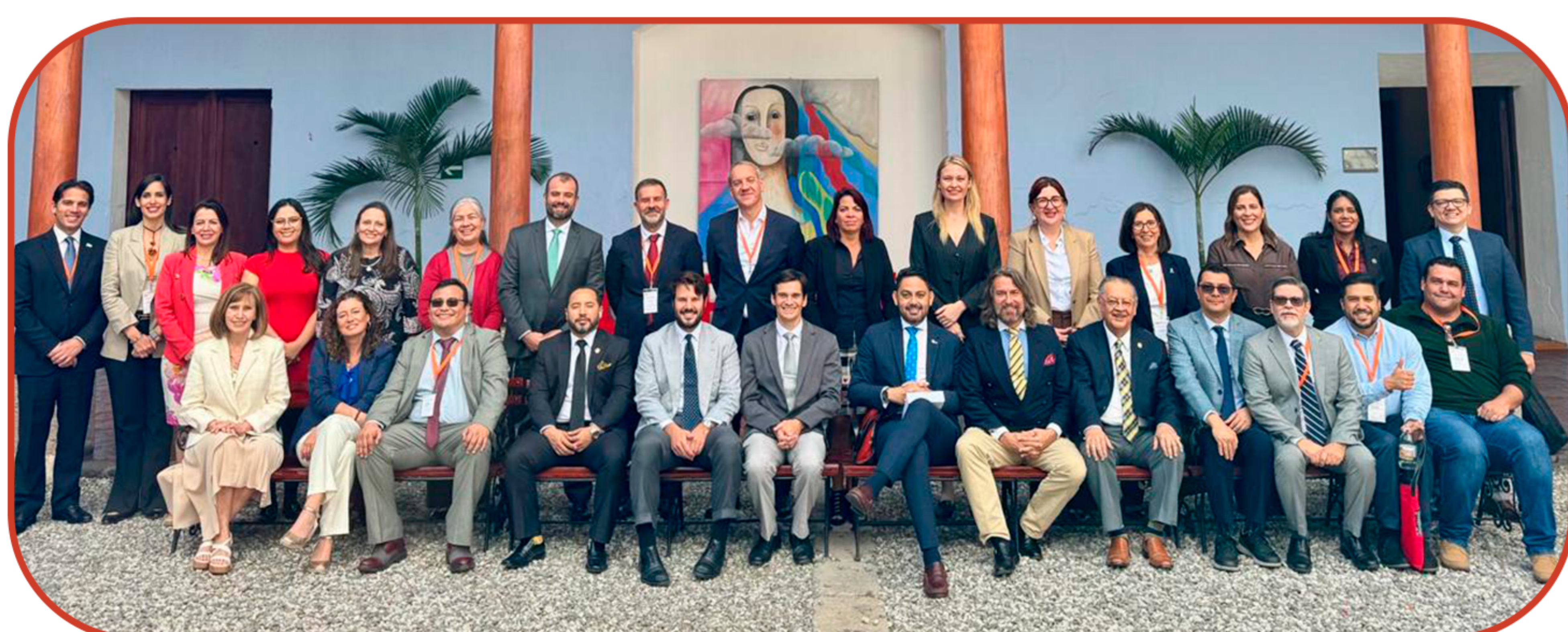
ALTOS REPRESENTANTES DE IBEROREG, ASSEMBLEIA DE 28 DE NOVEMBRO EM ANTÍGUA GUATEMALA.

Desta forma, os membros da IBEROREG reafirmam o seu compromisso em velar por um sistema de registo eficaz e eficiente ao serviço do bem comum.