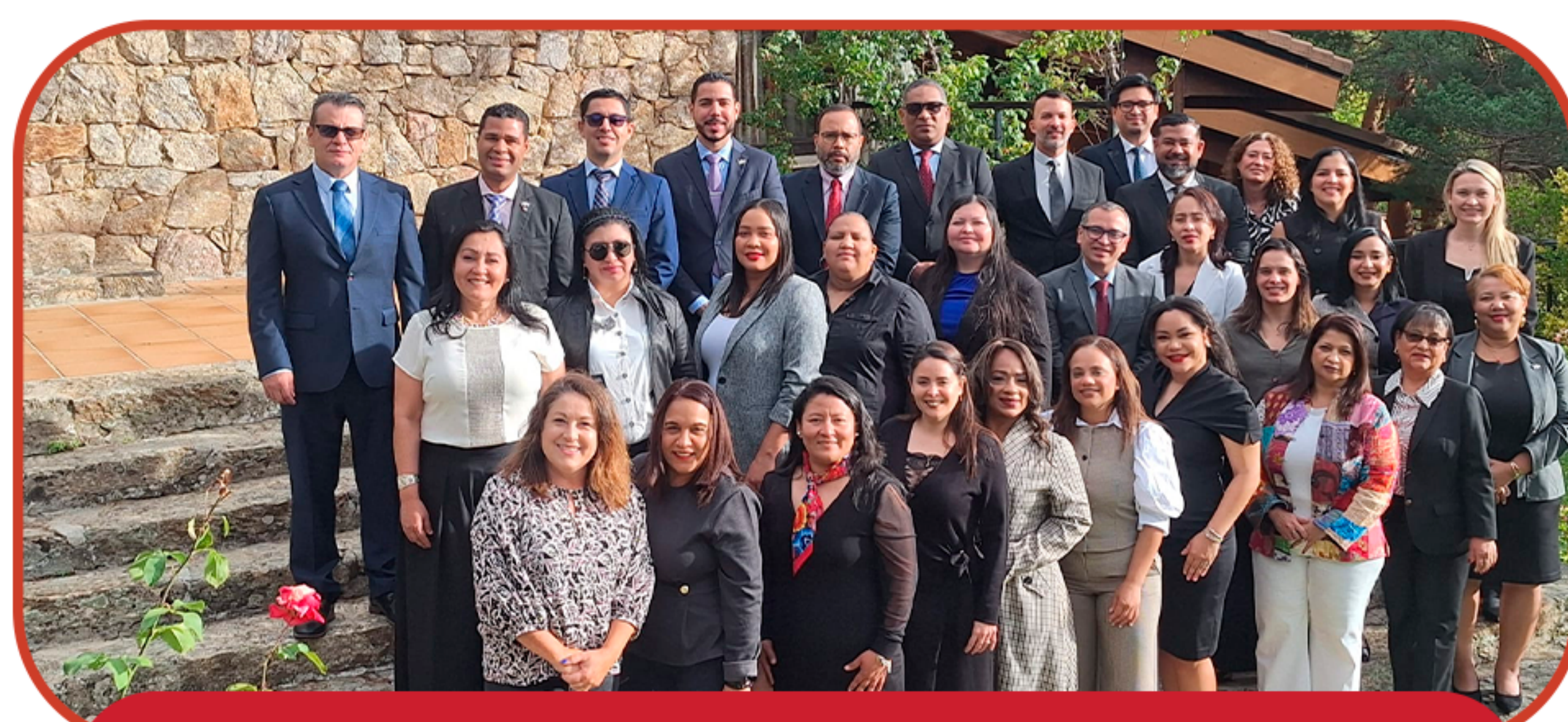
CADRI REGISTO PREDIAL