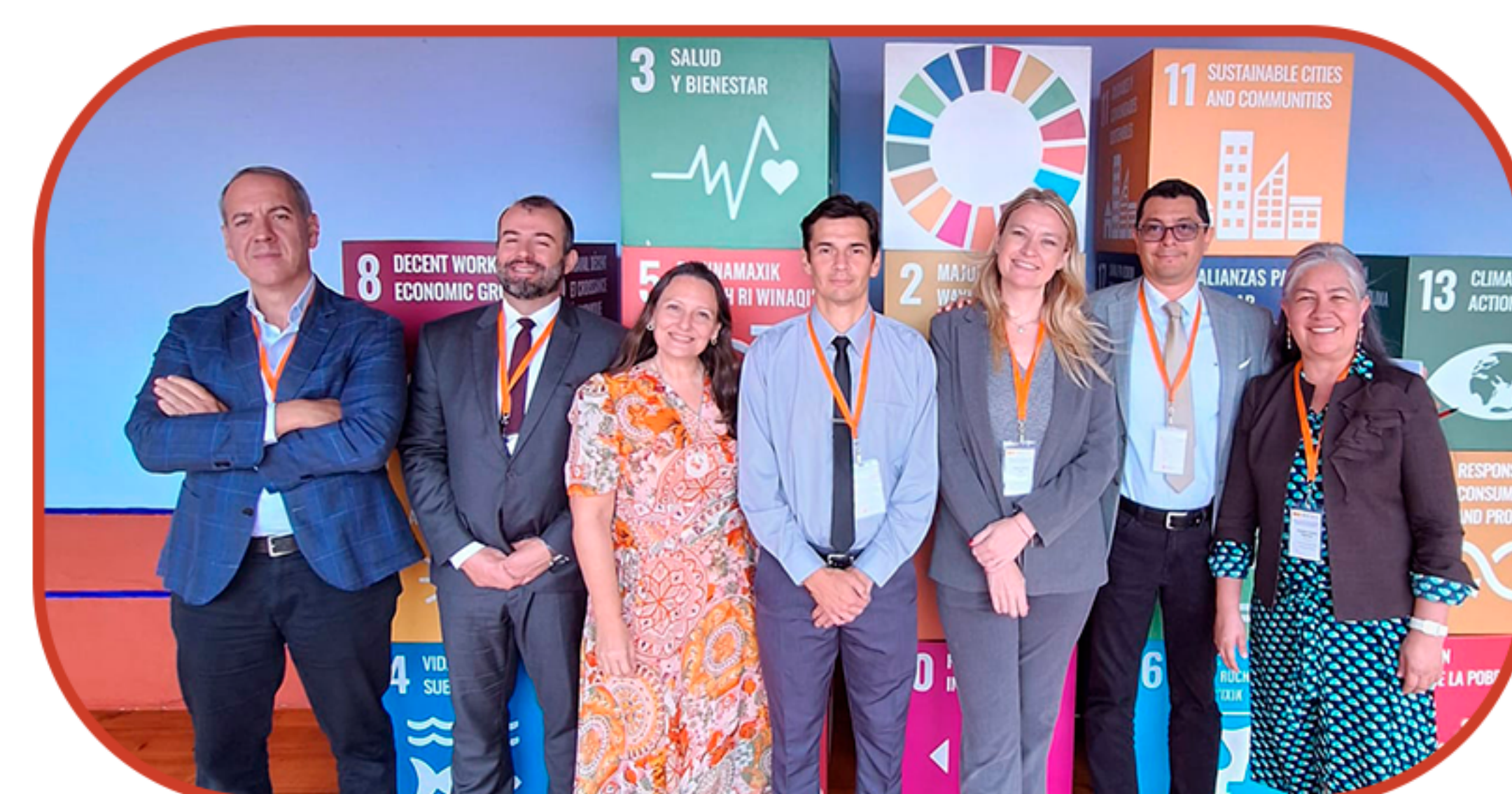
REUNIÃO ACADEMIA NOVEMBRO, EM ANTÍGUA GUATEMALA