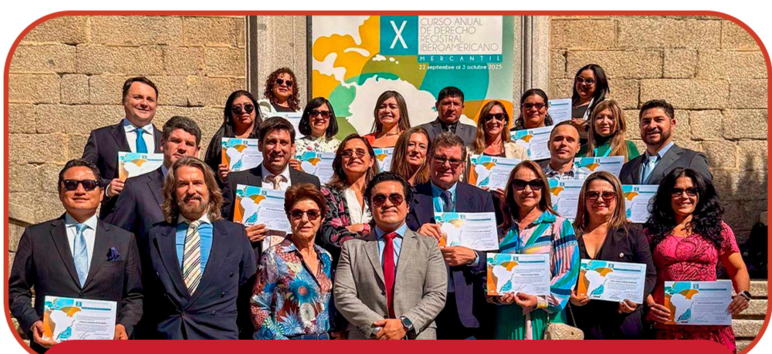
CADRI REGISTO COMERCIAL

¡Parabéns aos novos graduados pela meta alcançada, fiel reflexo do seu grande compromisso com a atividade registral Ibero-Americana!