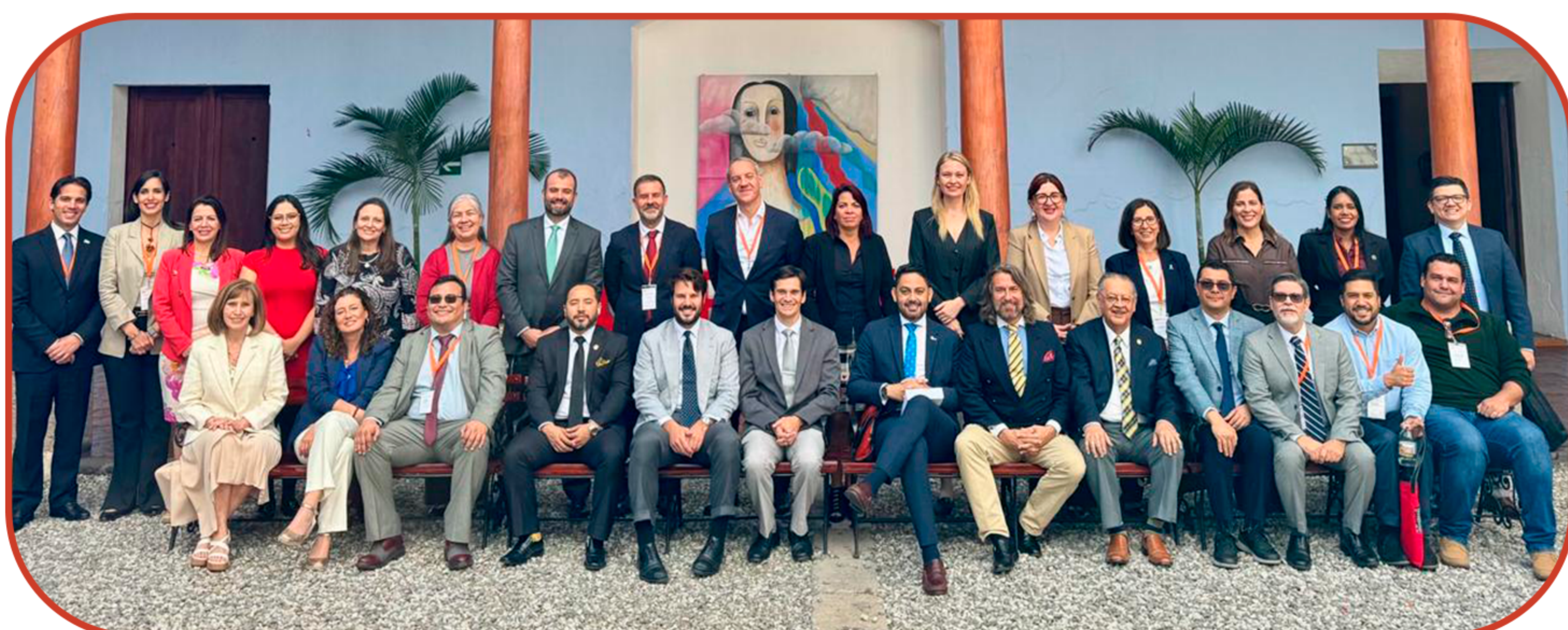
ALTOS REPRESENTANTES DE IBEROREG, ASAMBLEA DEL 28 DE NOVIEMBRE EN ANTIGUA, GUATEMALA

De esta manera, los miembros de IBEROREG reafirman su compromiso en velar por un sistema registral eficaz y eficiente al servicio del bien común.