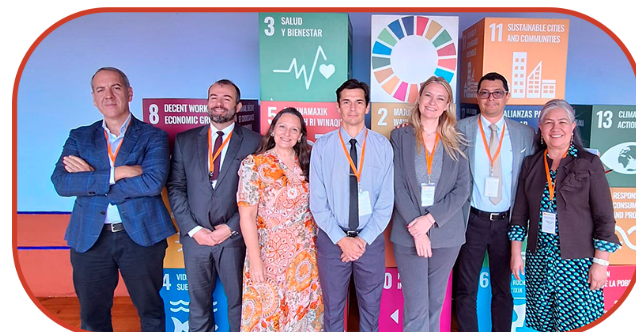
REUNIÓN DE ACADEMIA NOVIEMBRE, EN ANTIGUA, GUATEMALA.